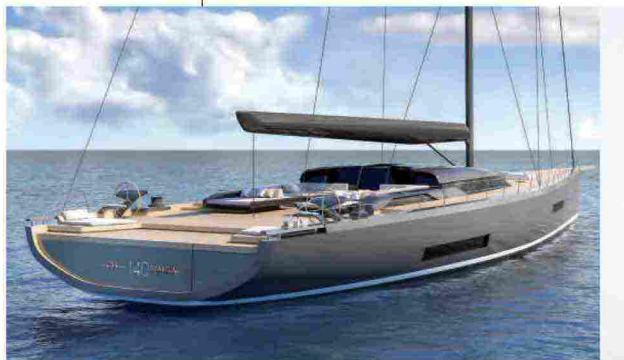
CON NAUTA DESIGN Il nuovo 42 m su progetto di Nauta Design. The new 42-meter yacht by Nauta Design.