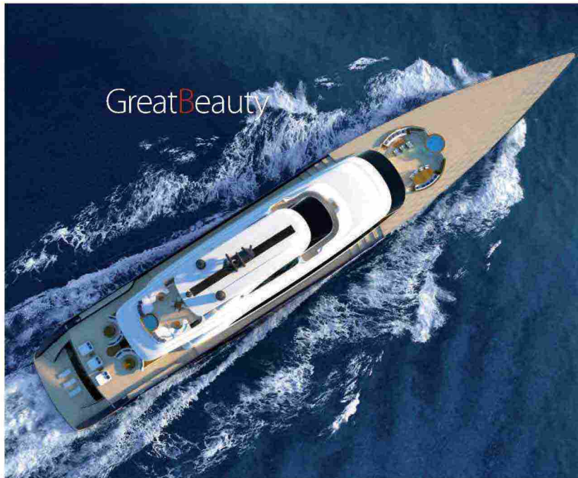
ARGONAUT Il 92 m Argonaut su progetto Perini. The 92-meter Argonaut designed by Perini.