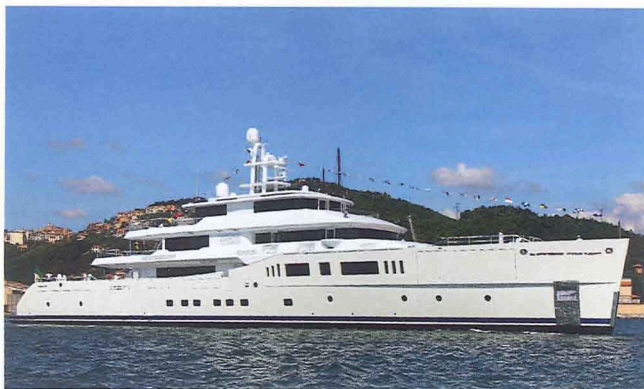
“Grace E”：Picchiotti 在Yildiz建造的73米Vitruvius 游艇。

73米长的Vitruvius系列迎来了第三名成员——“Grace E”，该系列均由Picchiotti为Perini Navi集团所造。这艘新游艇也遵循了平台设计的理念，建立在与其姐妹“Exuma”和“Galileo G”同样的船身和上层结构基础上。“Grace E”的动力由柴油电动机和两台Azipod发动机提供。目前预计巡航速度为16.5节。该系列游艇是设计师专为在地中海和加勒比海上航行所做的设计。上甲板被称为健康甲板，配有健身房、桑拿房和水疗设施。交付时间：今年年底。